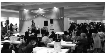
多くの来場者で賑わう会場