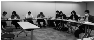
合同会議も開催された

4/20には会場別フロアにて、協同組合連絡会と共済担当者の合同事務局会議も開催された。長期休業補償保険の団体割引30%を維持するための議題について、各県から参加の事務局が様々な意見交換をし、制度の課題や今後の見通し、解決策などを協議する場も設けられた。