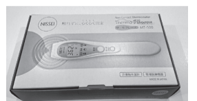
非接触の体温計は納期未定が続く

納期未定の商品もあるが、県内では入荷しない商品がM&Dを通じては購入可能な場合もあることから、引き続き利用頂きたい。